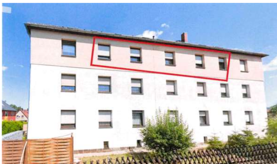
Haus Ernst-Thälmann-Straße 19

Der Eigenbetrieb Wohnungswirtschaft der Gemeinde Neukirch/Lausitz verkauft die vermietete 3 – Raum - Eigentumswohnung inmitten des Oberlausitzer Berglandes mit Garage, Stellplatz, Garten